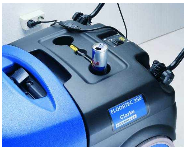
Panel sterowniczy z wskaźnikiem naładowania baterii